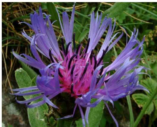
Ed.resp.: Vermeylen Jan

Les cotisations sont à verser au compte BE 71 7320 3610 5269 en mentionnant le nom de l'affilié dans la communication.