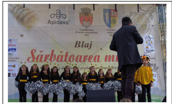
Remplissage à main par piston doseur