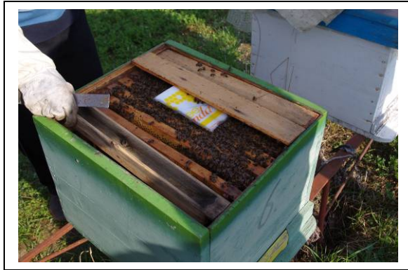
Nourrisseur cadre (bois évidé) et candi

Nous avons aussi visité des apiculteurs locaux. Les colonies sont des Dadant 10 cadres HOFFMAN avec 6 cadres occupés. Il faisait encore frais la nuit.