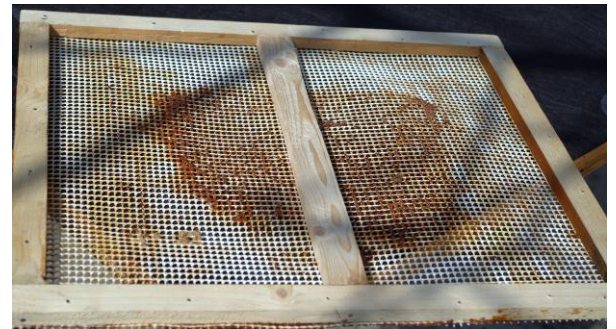
Filet à propolis à maille de 3mm en nylon

Nous avons aussi visité des apiculteurs locaux. Les colonies sont des Dadant 10 cadres HOFFMAN avec 6 cadres occupés. Il faisait encore frais la nuit.