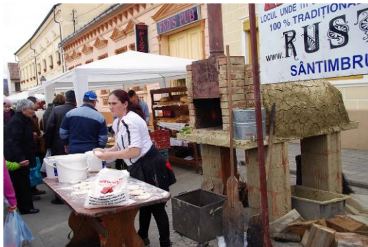
Le four à pain, construit la nuit du marché !

conférences apicoles à la mairie, des animations...la voiture (célèbre Fiat Polski de l'époque communiste) qui sillonne l'Europe avec la pétition contre les néonicotinoïdes...Nous étions aussi l'attraction des TV nationale et privée.